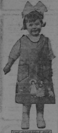
THE ADORABLE ONE

Plans play for small children are following on the heels of rompers for creeping babies, smocks being in the lead. This three-year-old wears a pinafore from the shoulders, dark blue linen bound with black silk braid and beaded, in her estimation, with delightful kindergarten creatures.